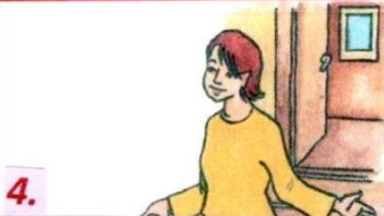
4. .... у дом падарожных