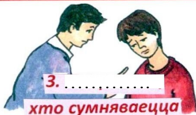
3. .... хто сумняваецца