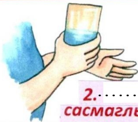
2. .... сасмаглых