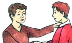
5. Зносіць цярпліва .....