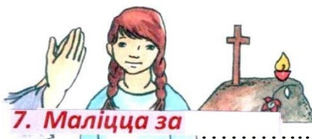
7. Маліцца за .....