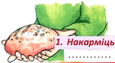
1. Накарміць .....