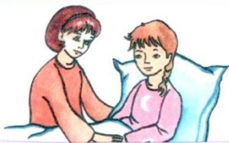
5. Адведваць .....