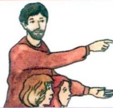
2. .... Вучыць тых,