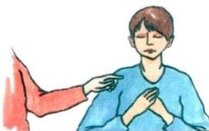
6. Дараваць .... крыўду