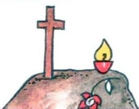
7. .... памерлых