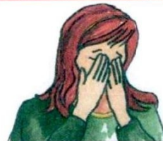
4. Суцяшаць .....