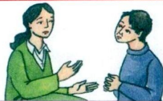
1. .... грэшнікаў